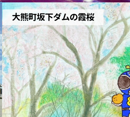
大熊町坂下ダムの霞桜