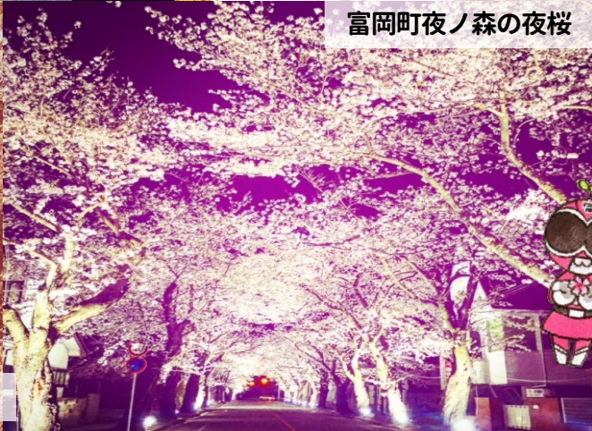
富岡町夜ノ森の夜桜