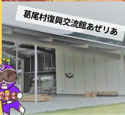
葛尾村復興交流館あぜりあ