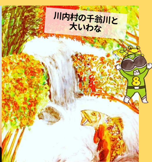
川内村の千翁川と大いわな