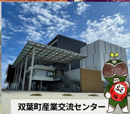
双葉町産業交流センター