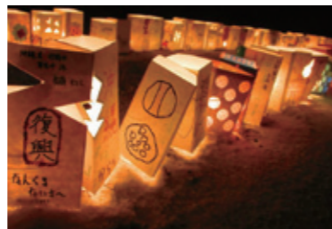
祈りの灯火 2014 会場で灯します